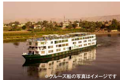
※クルーズ船の写真はイメージです

アスワン近郊は実は見どころの多い一帯です。川辺には砂漠のような風景が広がり、ナイル川では白い帆かけ船・ファルーカでのセイリングをお楽しみいただけます。青を中心にしたフォトジェニックなことでも有名なヌビア村も訪れます。